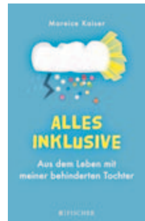
Mareice Kaiser: Alles inklusive. Fischer, Frankfurt 2016, 283 Seiten, 14,99 Euro

Katholiken wissen, dass ihre Priester gewöhnliche Menschen und Sünder sind. Aber deren Priestertum gilt auch noch dem 2. Vatikanischen Konzil als dem Wesen, nicht nur dem Grade nach verschiedenen vom Priestertum der Getauften. Es repräsentiert Christus, das Haupt der Kirche, nicht nur in der liturgischen Funktion, sondern in der ganzen Existenz. Von diesem Amtsverständnis her kommt auch die Vorstellung, man müsse, weil Christus sein Menschsein als Mann gelebt hat, diese Art der Repräsentation Männern vorbehalten. Das hat eine antignostische Spitze; die Menschwerdung soll sich nicht in den Mythos verflüchtigen. Allerdings bleibt das Thema Weihe für Frauen weiter in der Diskussion. Ich persönlich glaube, wir sind an der Stelle noch nicht fertig.