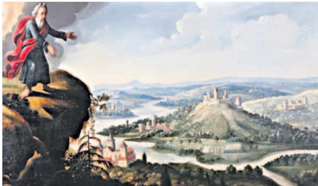
Mose schaut auf das gelobte Land: Eines der Bilder in der aktuellen Ausstellung.