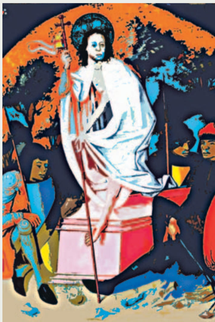
SPANISCHES GEMÄLDE AUS DEM 15. JHD., UNBEKANNTER KÜNSTLER