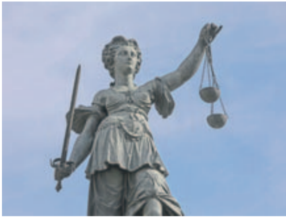
Steht seit 1611 auf dem Römerberg: Die Frankfurter Justitia ist eine der wenigen ohne Augenbinde.