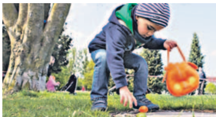
Eiersuchen und Osterhasen – was hat das mit Auferstehen zu tun?

W eihnachten mit Kindern ist einfach. Ein Stall, zwei Huftiere, drumherum die Bilderbuch-Familie (Mama, Papa, Zeugungsdetails in dieser Phase irrelevant), Engel, Jesusbaby, Sterne: Leuchtet ein, macht Spaß. Aber Ostern? So richtig kindgerecht und flüssig lässt sich die Geschichte von einem leeren Grab kaum erzählen. Dazu noch dieses merkwürdige Wort: auferstanden. Und ein Hase, der immer dazwischenhüpft.